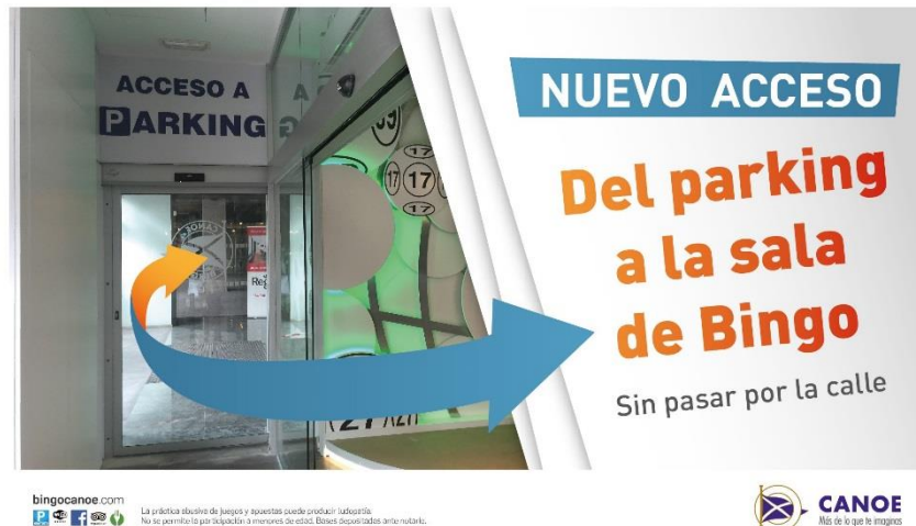
Señalética indicando el nuevo acceso directo al Bingo CANOE

Y es que la Compañía está apostando por mantener a CANOE en los puestos de liderazgo que desde el inicio de su actividad ha ostentado, siendo siempre referente del sector.